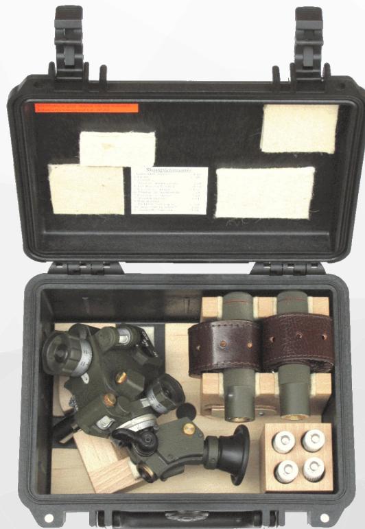
MC-60 sight with accessories